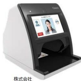
株式会社 富士通マーケティング