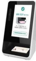
パナソニックシステム ソリューションズジャパン 株式会社