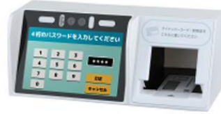
株式会社 アルメックス